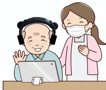
บ้านพักคนชรา