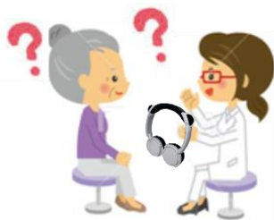
โรงพยาบาล